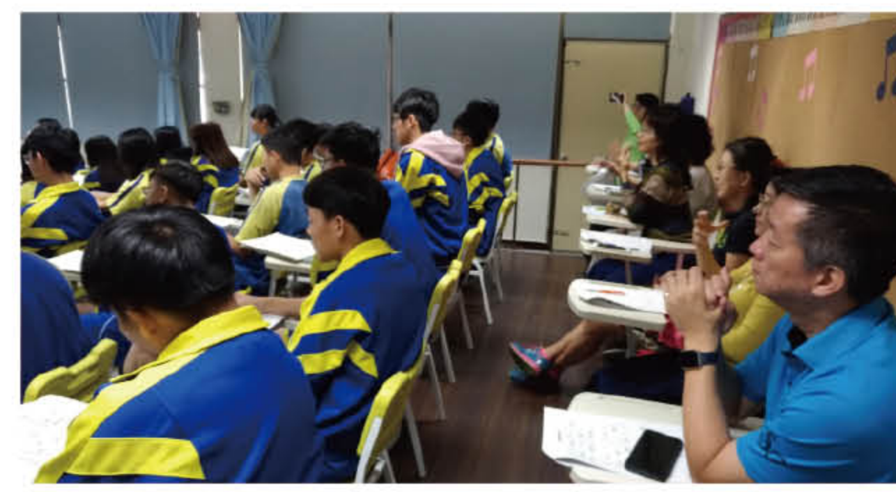
107 年 10 月 30 日多媒體 APP 教學觀課