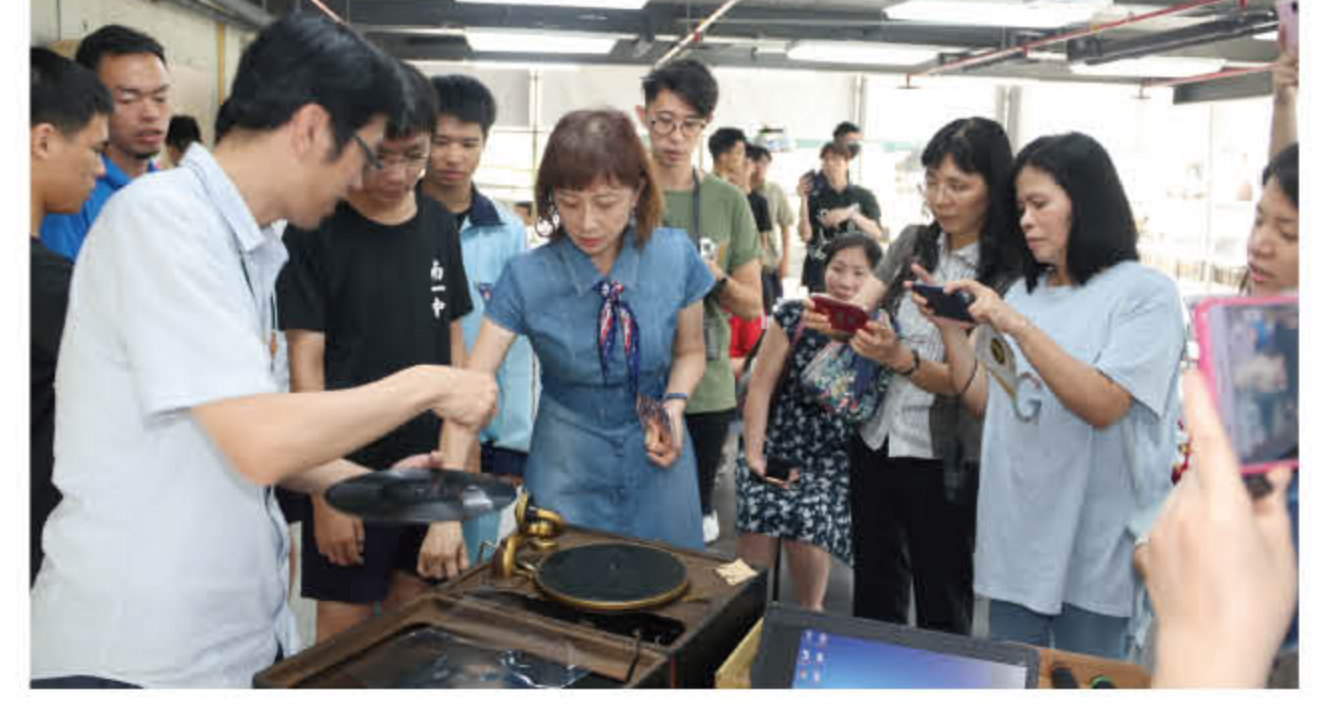
108 年 4 月 26 日多元課程-黑膠唱片