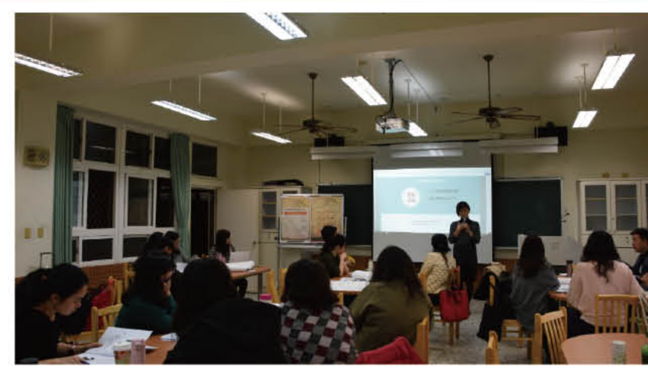
108 年 3 月 25 日課綱宣導培訓