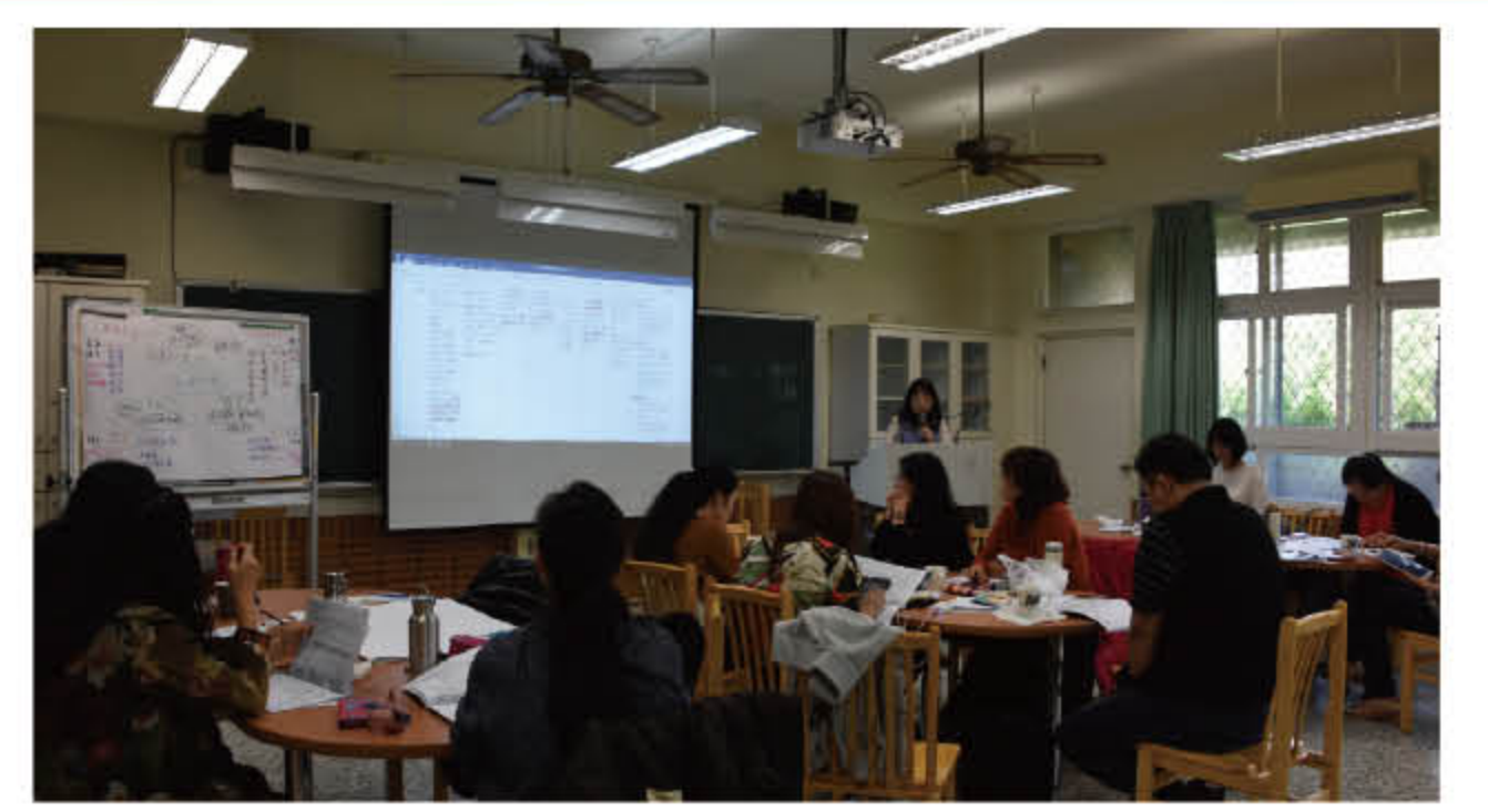
108 年 3 月 26 日音樂科課程地圖