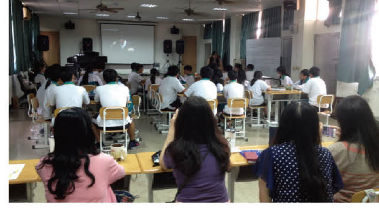
107 年 10 月 18 日主題觀課