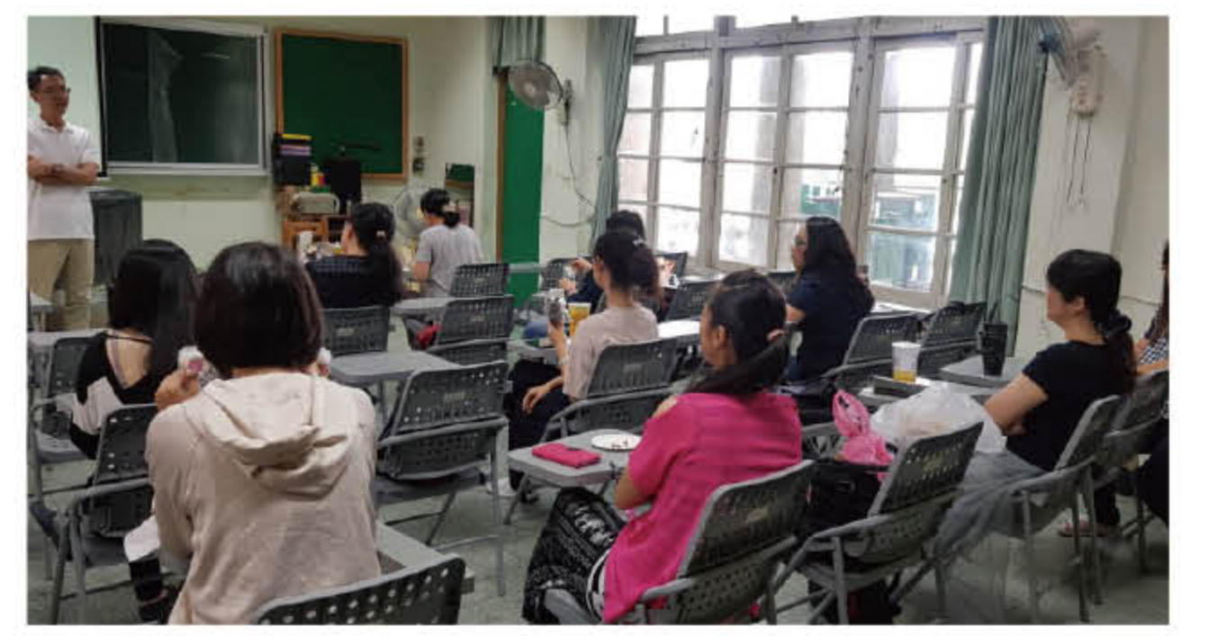
108 年 5 月 14 日主題講座