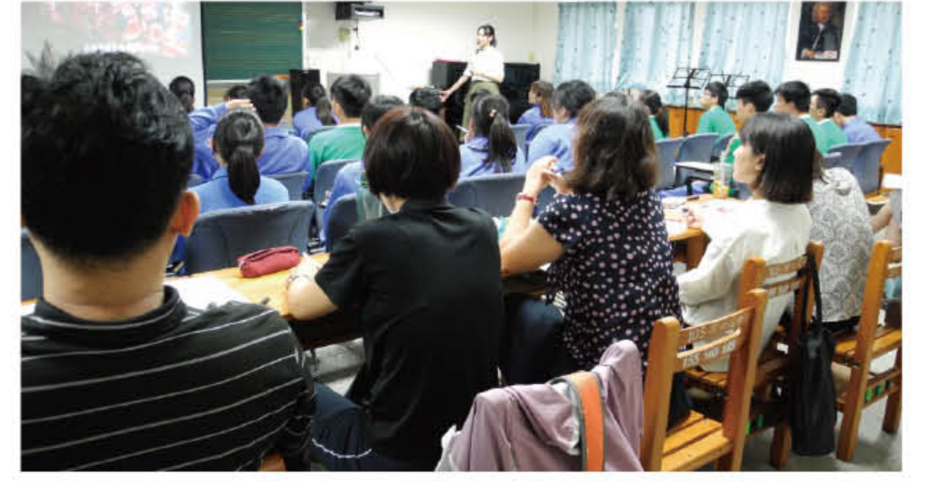
108 年 4 月 30 日主題觀課