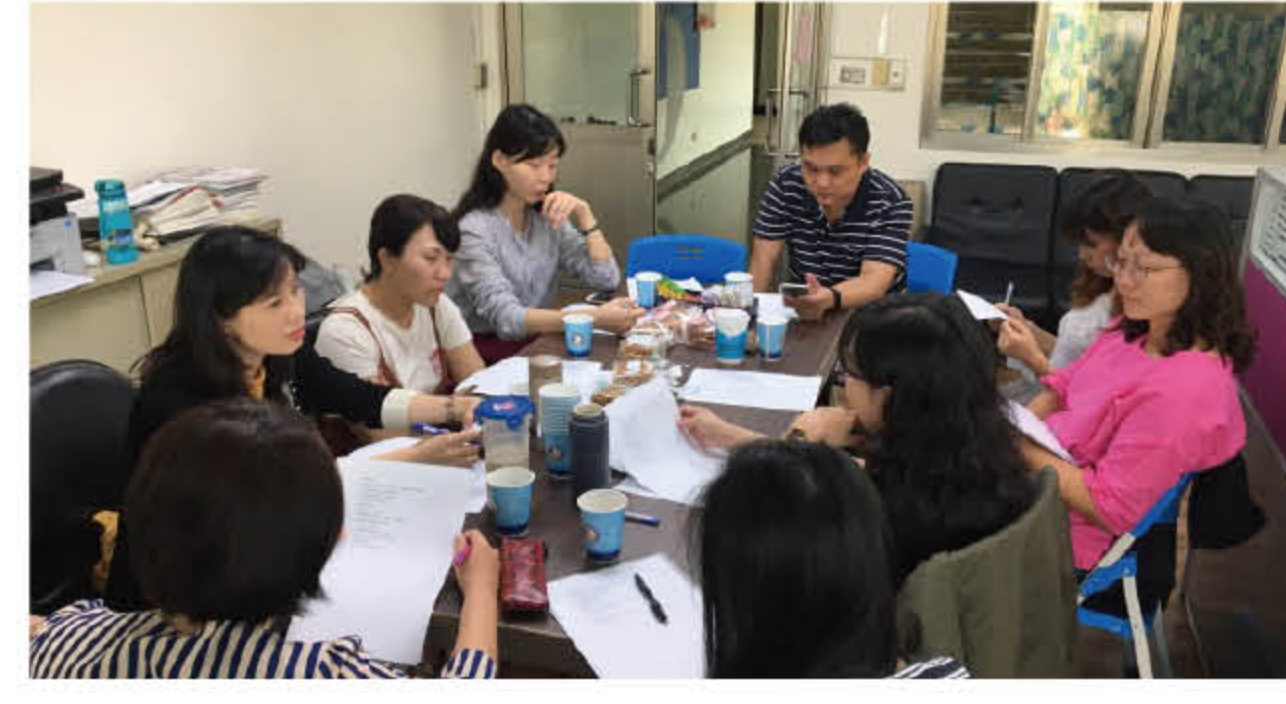
107 年 11 月 13 日議題研討省思與對話